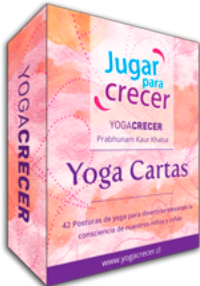
Caja Yoga Cartas